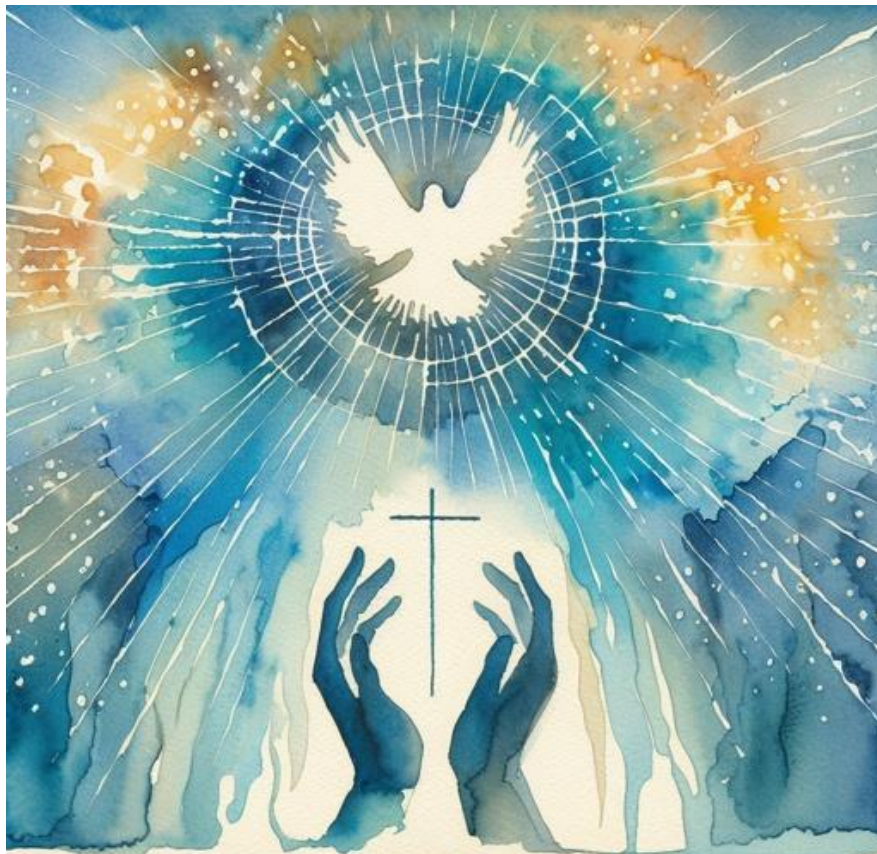
Psalm 139. Bible Art