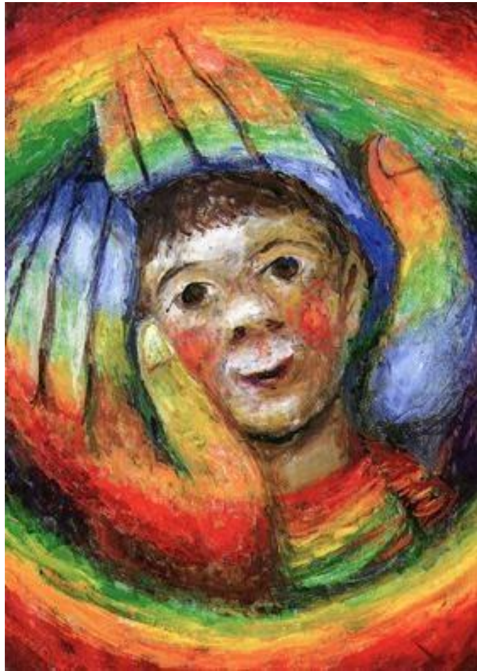
In the hands of God